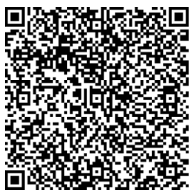
Примерный перечень произведений изобразительного искусства